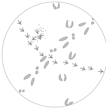
Fasan, Reh, Hase